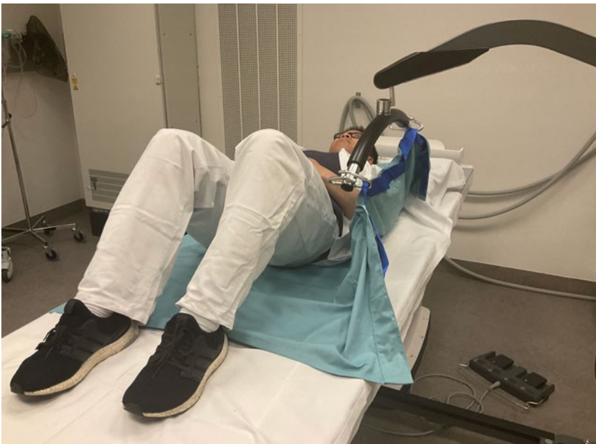
Spiler+ hægtes på liftåget ud for skulder og hoft i venstre side.